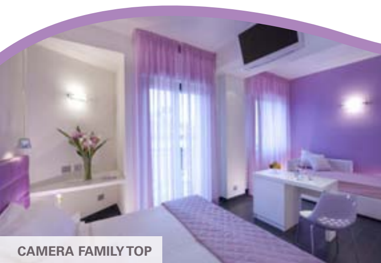
CAMERA FAMILY TOP

Per meglio allietare la vacanza dei nostri piccoli ospiti, e al tempo stesso rendere più tranquillo il soggiorno dei genitori, abbiamo pensato proprio a tutto: un simpatico omaggio all'arrivo, "Babylandia" un'allegria saletta attrezzata con giochi adatti ad ogni fascia di età, animatrice in hotel durante l'orario dei pasti, menù su misura per i bambini e comodi orari per i pasti, seggioloni, tovaglie da colorare, piattini e posatine baby, culle, spondine, scaldabiberon, lucine notturne, biciclette con seggiolini, angolo in giardino attrezzato con scivoli e giochi, piscina a misura di bimbo con acqua alta 50 cm.